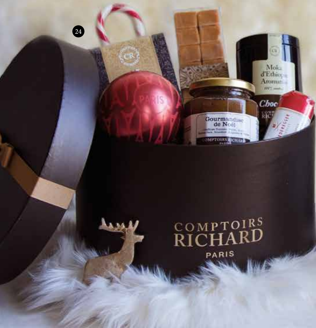
24. Douceurs de Noël, coffret ø25x15 cm