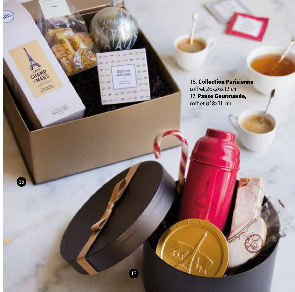
16. Collection Parisienne , coffret 26x26x12 cm 17. Pause Gourmande , coffret ø18x11 cm

Une collection de petits et grands coffrets gourmands autour de thématiques, à offrir en toutes occasions.