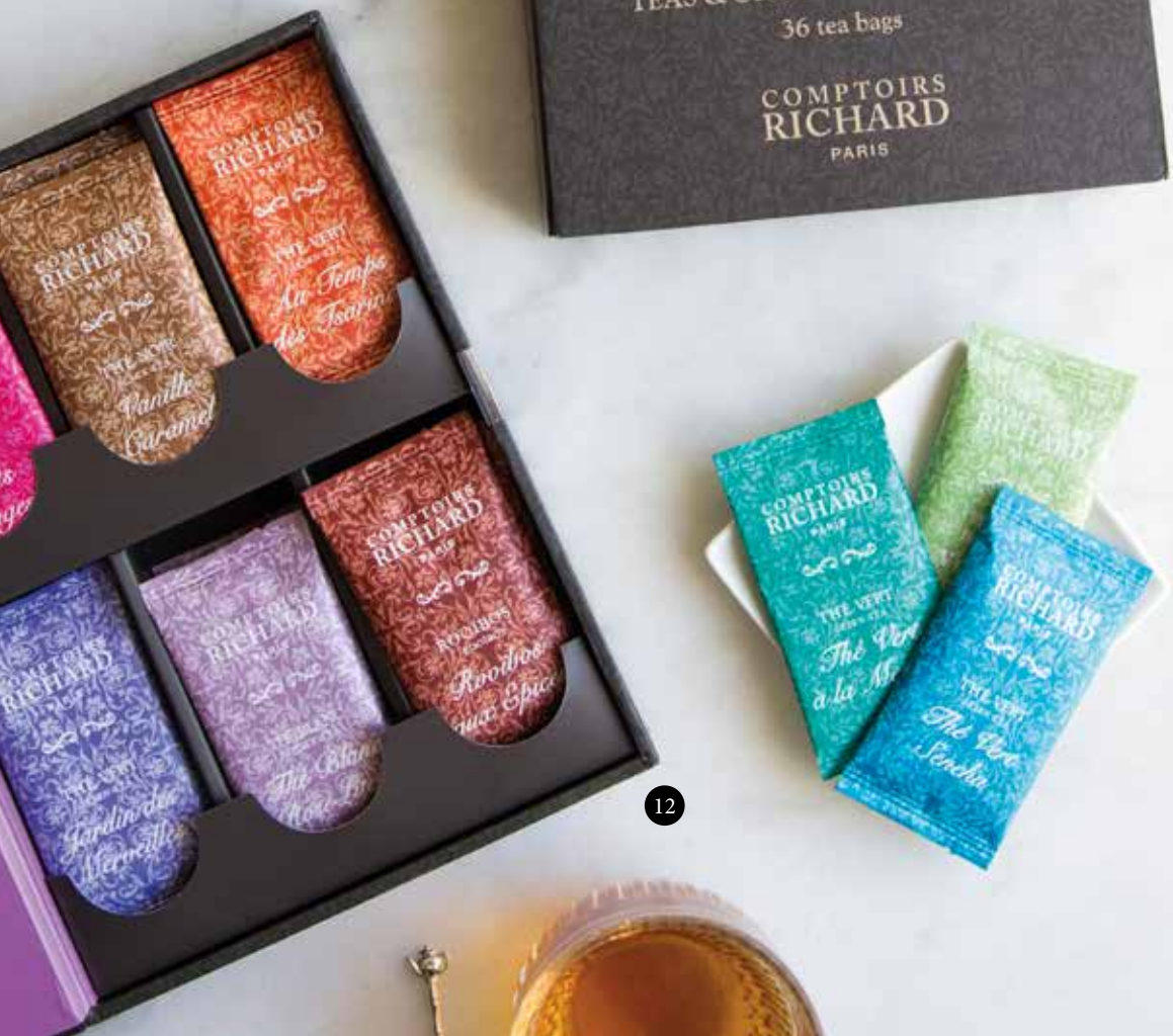
12. Assortiment Thés et Rooïbos « Les Gourmands » , coffret 36 sachets voile, 17,5x23x4,5 cm