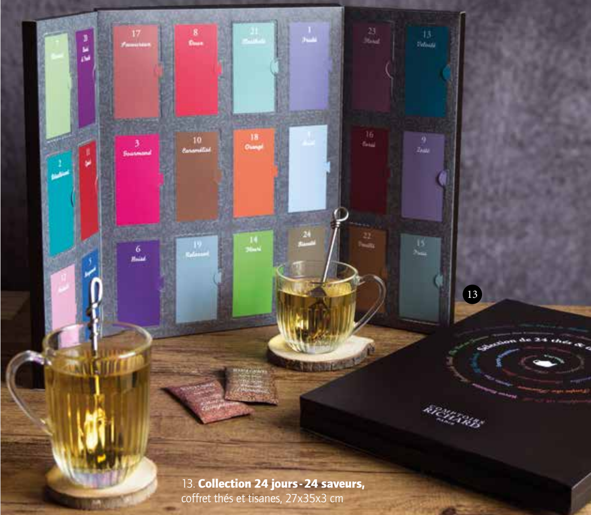
13. Collection 24 jours - 24 saveurs , coffret thés et tisanes, 27x35x3 cm